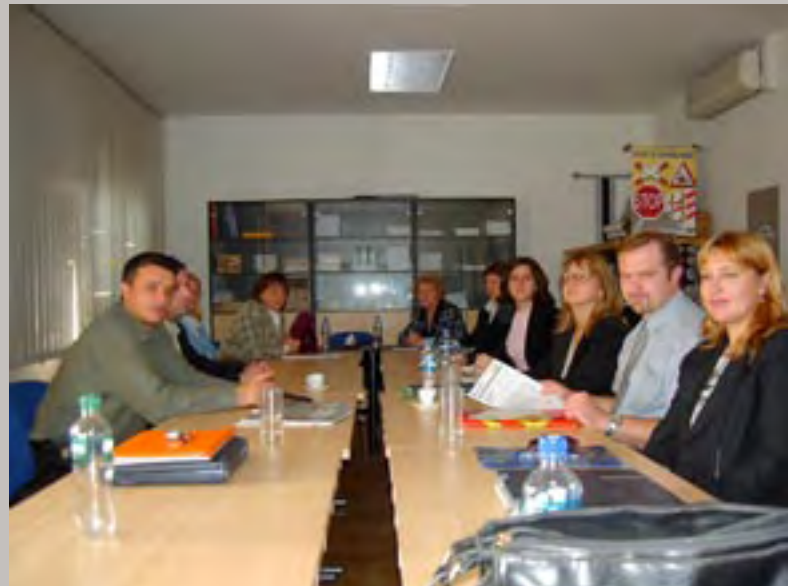
Hrvatske željeznice: Putnički promet i Cargo