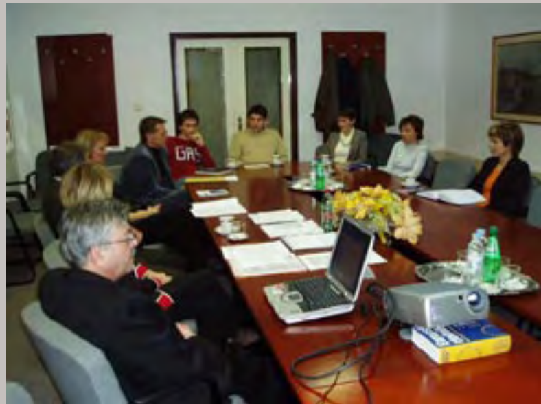
Virovitičko-podravska županija: Croming, Domogradnja, Ad Arma