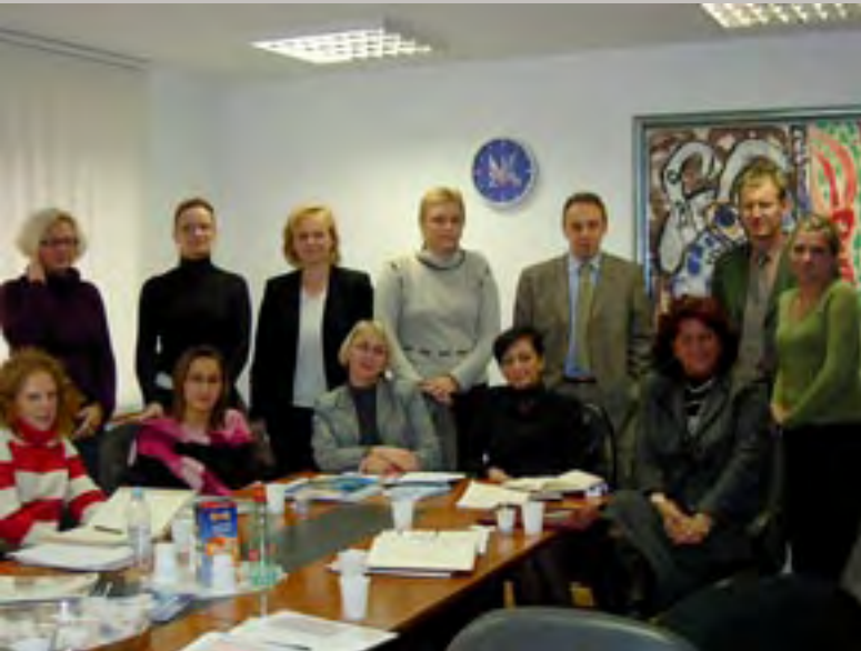
Grad Zagreb: Sunce global, Končar Institut, Tifon, Zračna luka Zagreb, Žitnjak