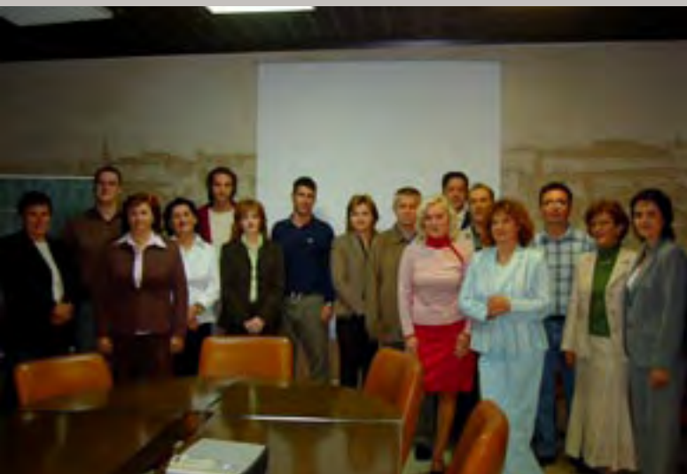
HEP - Distribucija: DP Elektroprimorje Rijeka, DP Elektra Koprivnica, DP Elektra Vinkovci, DP Elektra Zadar, DP Elektra Zagreb