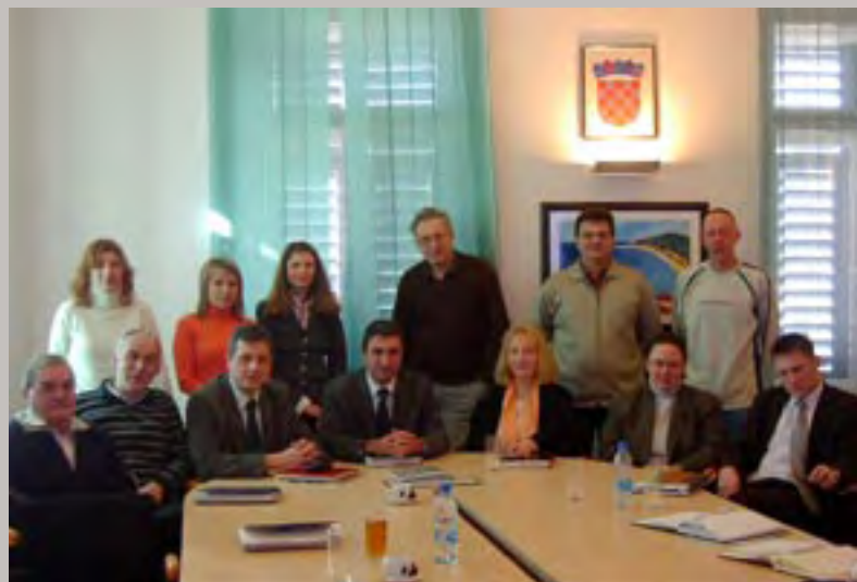
Uljanik: Brodogradilište, Proizvodnja opreme, Strojogradnja, IRI, Zajednički poslovi, Financije